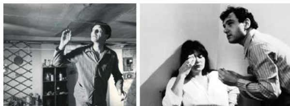
Tous les jours ; 1980 Réal. Jean-Denis Bonan

A noter : BLEU PÂLEBPOURG , le dernier film de Jean-Denis Bonan est programmé à Paris au Saint-André des arts tous les jours à 13 heures (à partir du 16 octobre).