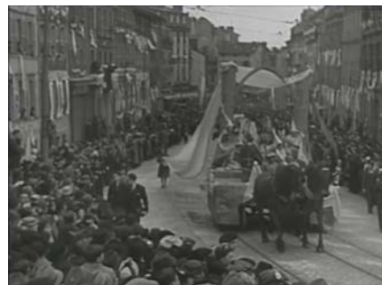
Ostensions pour la paix 1939