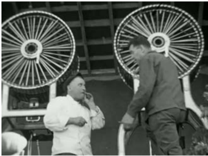
Loterie nationale à Bourgneuf 1953

Date/lieu : 13 octobre, Cinéma d'Aubusson (23)