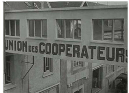
Union des Coopérateurs creusois 1929