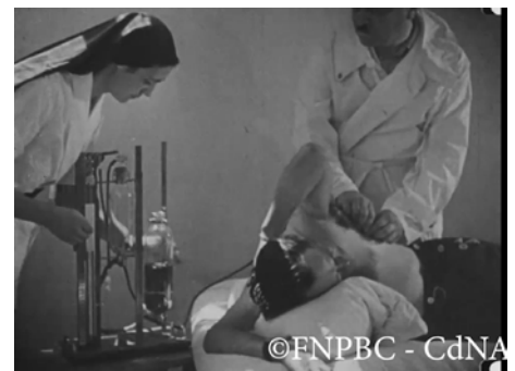
Cité sanitaire de Clairvivre Années 1930