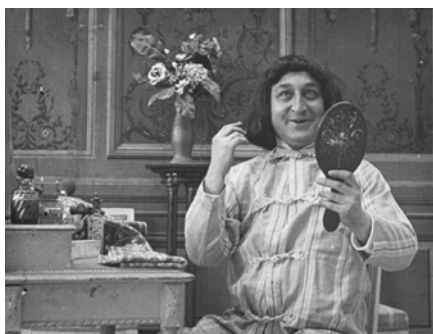
L'Elixir capillaire Production Pathé Frères Kok, 1912