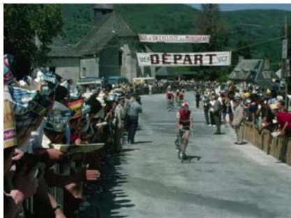
Bol d'Or des Monédières 1965